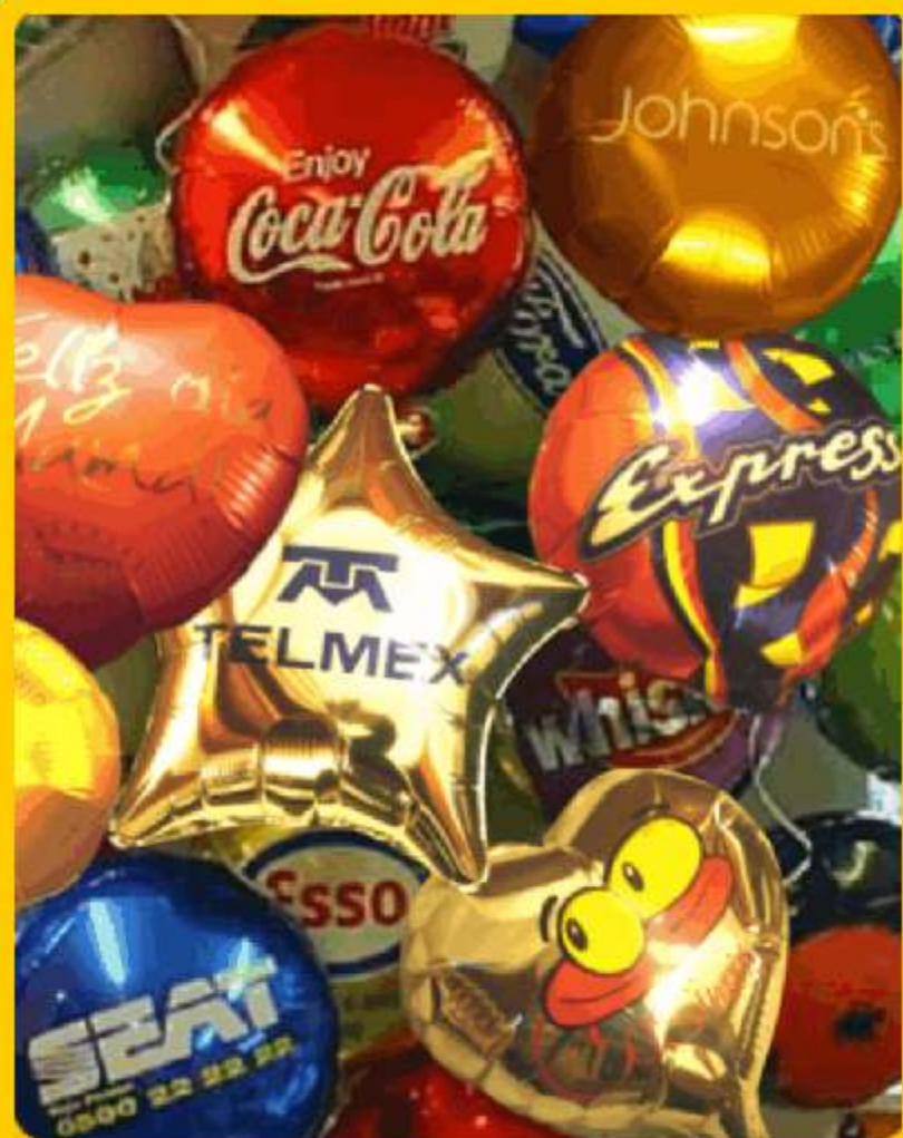
Logos en Serigrafía, Flexo, o Ploteado

-- Flexifoil MET/ Flexifoil SET: Distintas formas y tamaños (Estrella, Corazón, Redondo, ... 9" aire. 18" aire/helio." 1ra calidad, muestras a su disposición, impresos en Flexografía, grandes cantidades, 2 caras, hasta 4 tintas, o serigrafía pequeñas cantidades hasta 2 tintas. Contiene exclusiva válvula autosellable (sellado automático) listo para inflar / desinflar y vuelto a inflar.